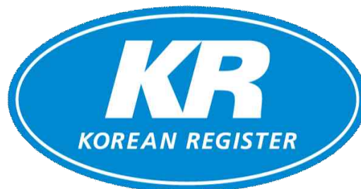
<기관 마크 이미지>